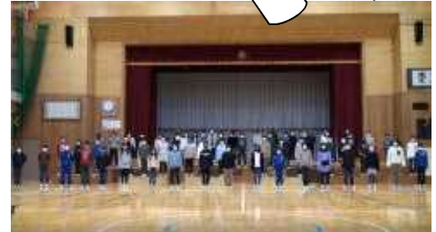
6年生を送る会の映像より

新学期までしばらくお休みが続きますが、次の学年、次の学校への橋渡しの時です。学習に必要な物を整えたり、学習の苦手な所を補ったりなど、様々なご準備をお願いします。