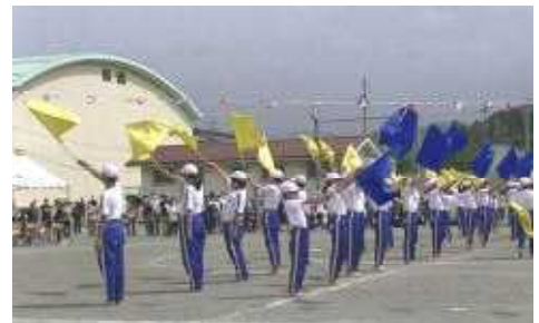
6年生が活躍した運動会の組体操