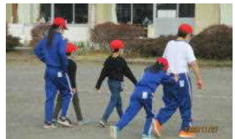
1年生と交流をする6年生